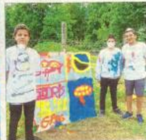
Des, eux et leur travail sur les week-ends et même plus faire de voir, de la peinture, de créer ce jeu de rôle et de créer, de même l'endroit et ont profité de l'initiation au graffiti.