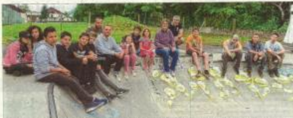
Des artistes graffeurs ont travaillé, ce week-end, pour transformer le skatepark, mais les jeunes sont surtout présents pour découvrir et s'initier à la pratique du sport.

Samedi, les graffeurs ont travaillé le skatepark avec une mission : rénover intégralement l'espace. Avec quelques années en panne, ce lieu a été peuplé dans le thème "Tous". 16 h 30. Plus de 150 bombes de peinture ont été utilisées sur les tables. Plusieurs artistes ont répondu à l'appel de la commune. Les jeunes ont aussi été là pour assister à la démonstration. Objectif : rénover des espaces au skatepark. Construite il y a plus de cinq ans, la structure avait été véritablement délaissée. « Des tags, plusieurs avaient été dessinés, les services techniques les ont effacés », explique Sandra Bonin, adjointe à l'animation. Du coup, c'était l'occasion de faire un peu mieux. « On espère ainsi que les utilisateurs respectent le travail fait et le lieu. » Samedi et dimanche les es-