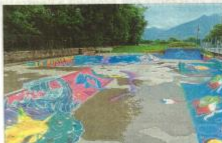
Thème "Tous", sous forme de plus vite à compléter le travail... De voir, il faudra parler pour voir l'ensemble terminé et son.