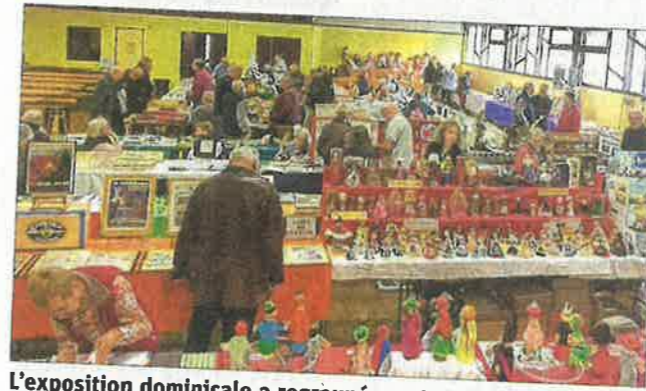
L'exposition dominicale a regroupé une trentaine d'exposants.

Pour plus d'informations sur cette association de collectionneurs, prendre contact auprès de Renée au 04 79 31 41 72 ou sur le site internet de Syllectomania : http://syllectomania.6mon.com