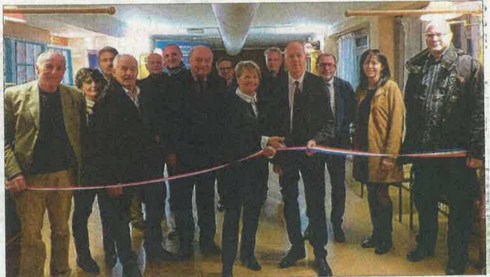
Ce foyer va permettre d'accueillir un public en attente d'accès à un logement.

Le foyer, réaménagé suite à des travaux intérieurs et extérieurs, a été inauguré le jeudi 7 no-