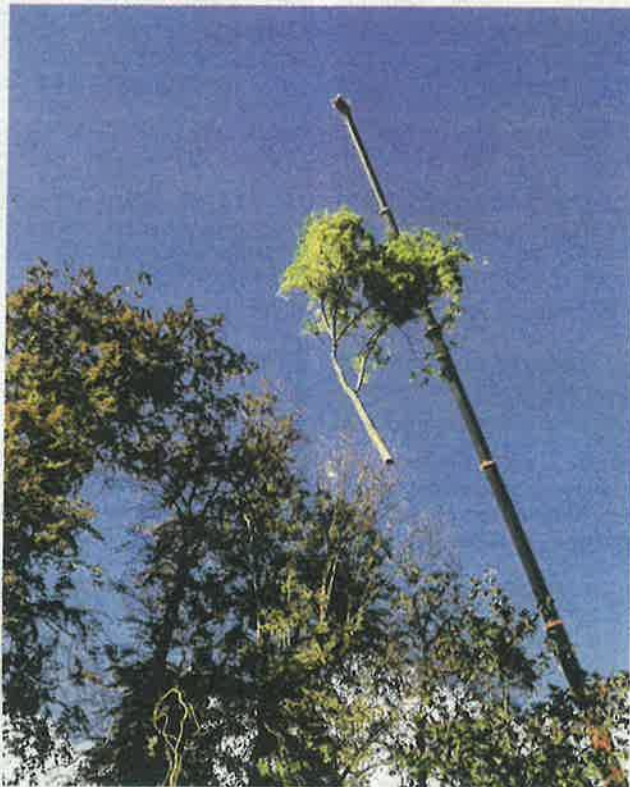
Cette opération d'abattage a nécessité beaucoup de moyens pour un coût global de 24500 euros.

Ce sont donc un sophora, un hêtre et un pin qui ont été abattus par deux entreprises mandatées mardi dernier, avec utilisation d'une grue vu