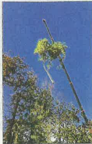
Un sophora, un hêtre et un pin ont été abattus à l'aide d'une grue.

Ainsi, après consultation de plusieurs entreprises, cette opération a