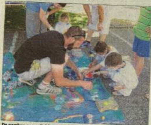
De nombreuses activités seront proposées aux enfants, le samedi 8 juillet, à l'occasion de la 4 e édition de Village en fête.

Plus d'informations auprès de la mairie : 04 79 31 40 10 ou commission-communication@frontenex.fr ou www.frontenex.fr